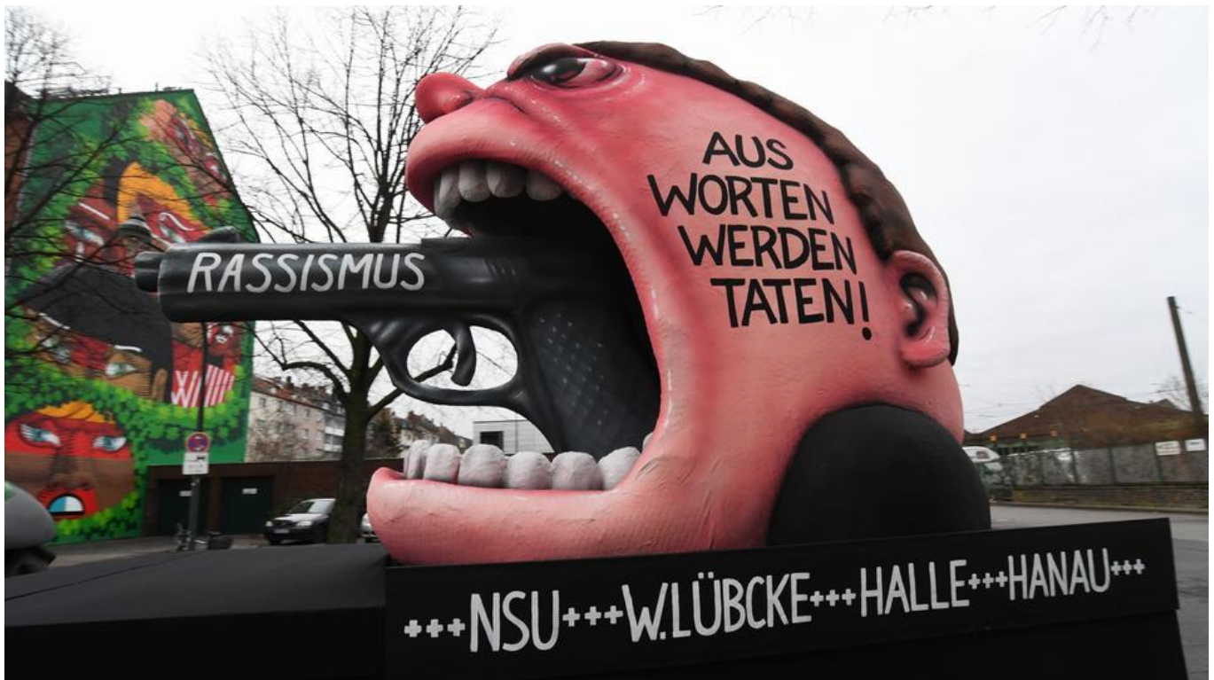
Motivwagen des Düsseldorfer Rosenmontags-Zuges

Die Morde von Hanau, die Schüsse auf die Synagoge in Halle - ob Juden, Christen, Muslime, das war ein Angriff auf alle. Wir leben hier zusammen, die Demokratie wird triumphieren, dieses Land werdet ihr niemals regieren.